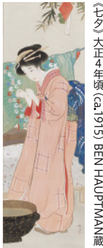
〔七〕大正4年頃(ca.1915) BEN HAUPTMAN蔵