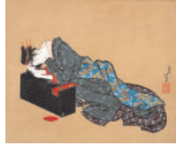
(餘余美人図(葛飾北斎筆) (公財)氏家浮世絵 コレクション所蔵