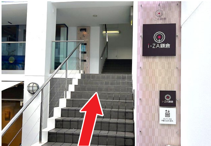
9 右手の階段を上り、3階へ行きます。