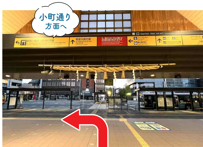
1 鎌倉駅東口から、小町通り方面に向かいます。