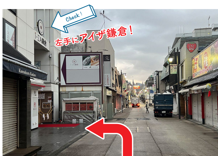
6 約15m歩き、左手に見えるアイザ鎌倉ビルへ入ります。