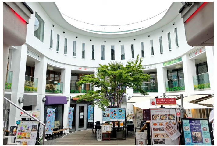
8 ウッドデッキ広場の手前まで進みます。