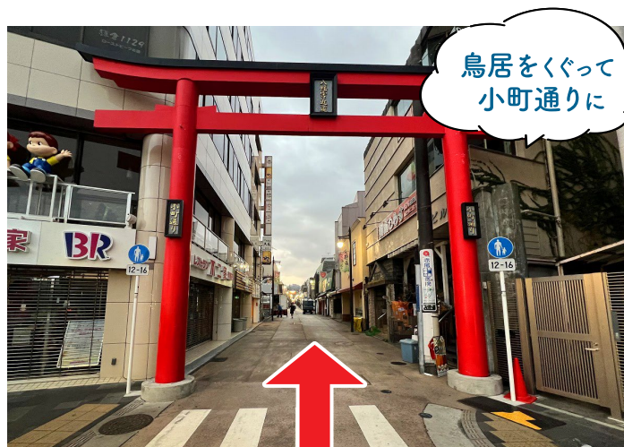
5 鳥居をくぐり、小町通りを約15m直進します。