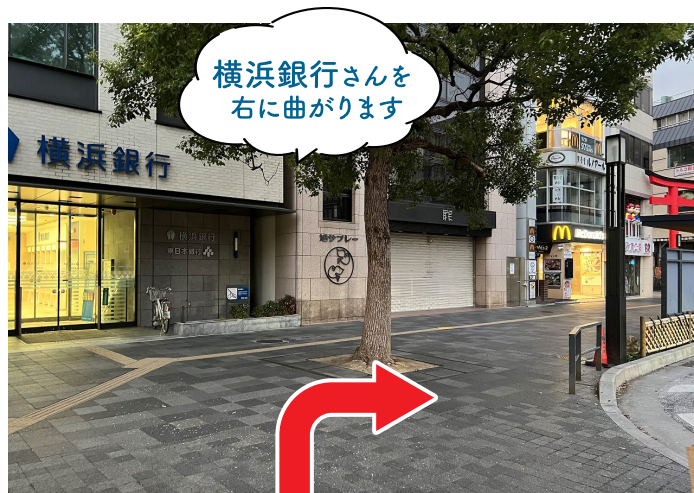
4 横浜銀行さんを右折し、鳥居を目指します。