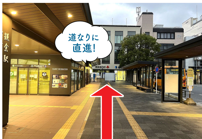
2 東口を出て、左折し道なりに進みます。