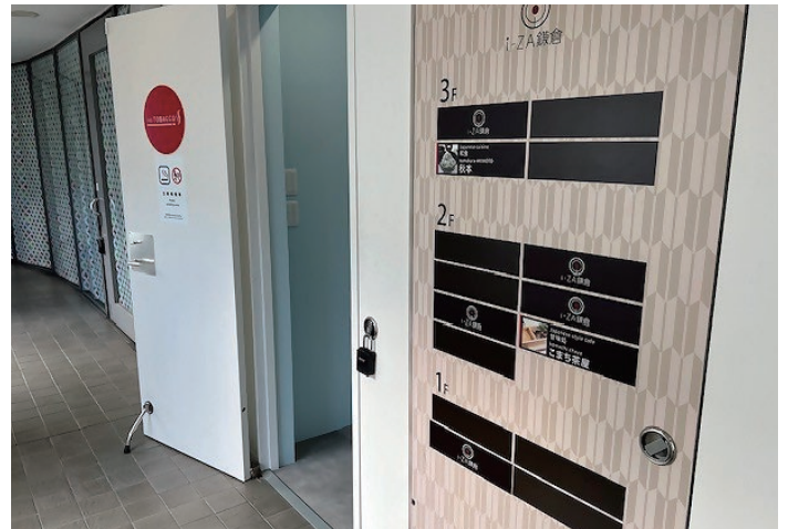
10 3階に上がると喫煙所が見えます。