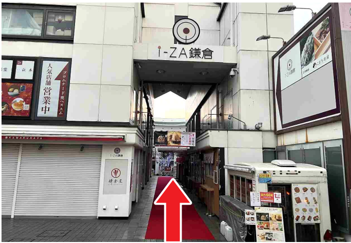
7 アイザ鎌倉ビルへ入り直進します。