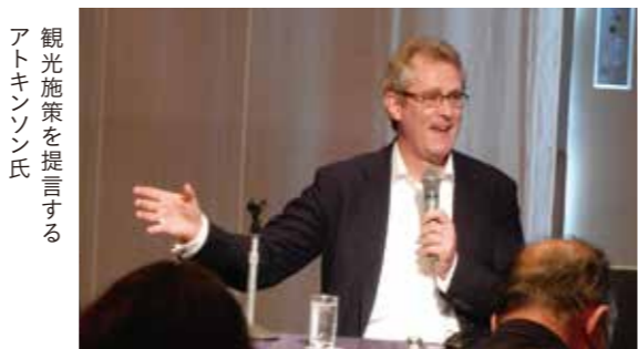
観光施策を提言するアトキンソン氏