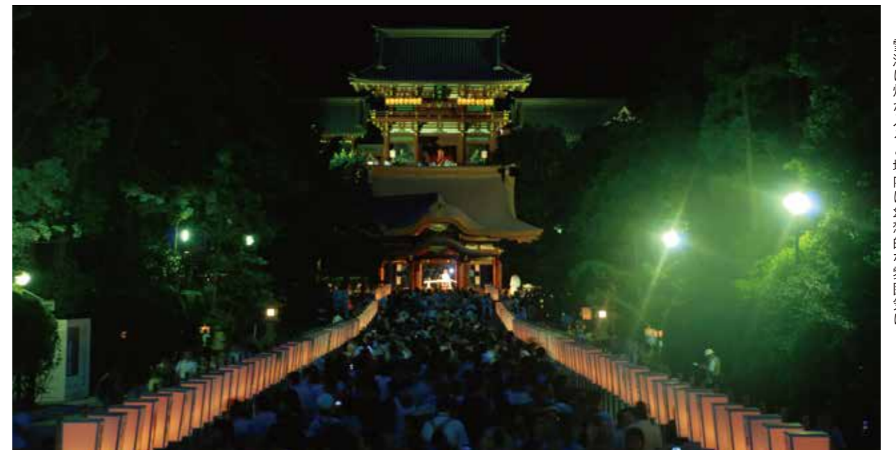
雪洞に灯が入ると境内は幻想的な雰囲気