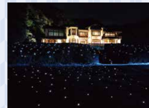
ライトアップされ美しい鎌倉文学館

ライトアップされるのは、鎌倉大仏殿高德院、光則寺、極楽寺、収玄寺、長谷寺、甘縄神明宮、御霊神社、鎌倉文学館の8会場。期間中は、周辺商店街での灯かりの演出、地域参加型の「お参り巡り企画」等の催しも行われます。