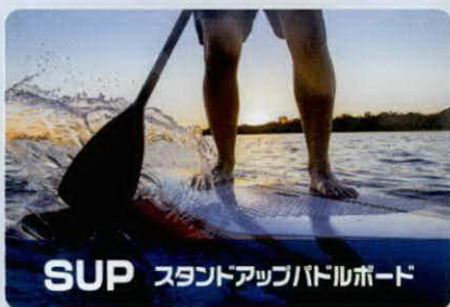
SUP スタンドアップパドルボード